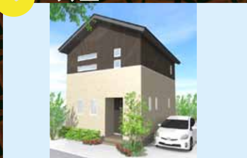
自宅の建て替え時に併設