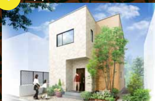
余っている庭先に建設